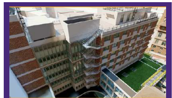
Future tour incendie Accès Pompiers